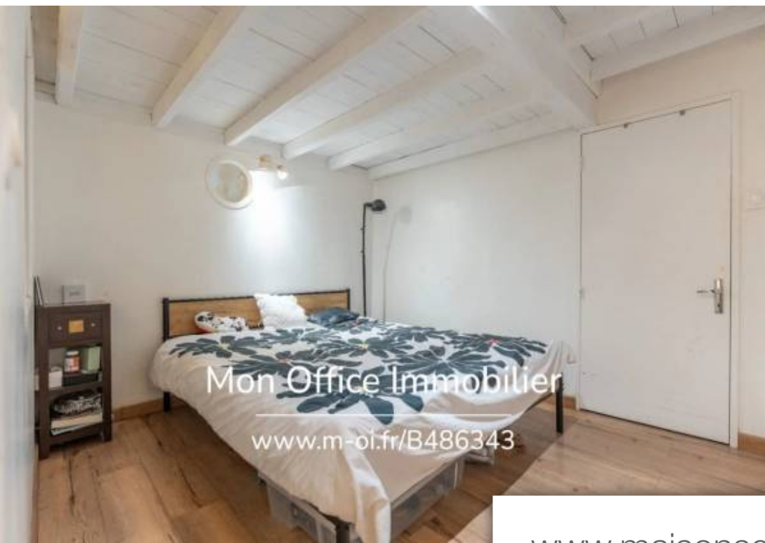
Mon Office Immobilier www.m-oi.fr/B486343