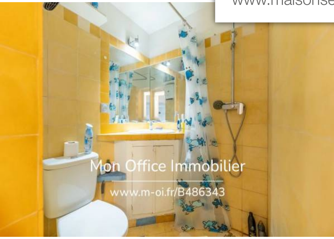
Mon Office Immobilier www.m-oi.fr/B486343