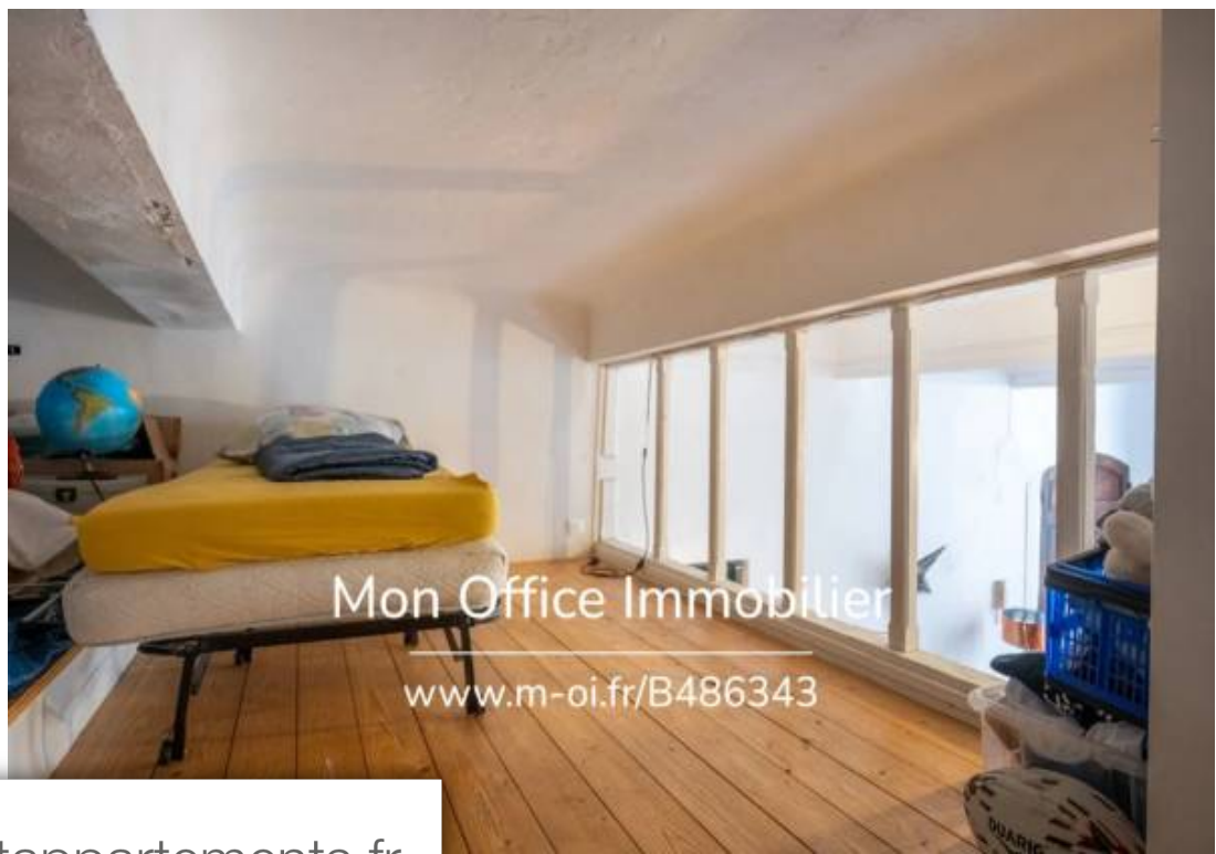
Mon Office Immobilier www.m-oi.fr/B486343