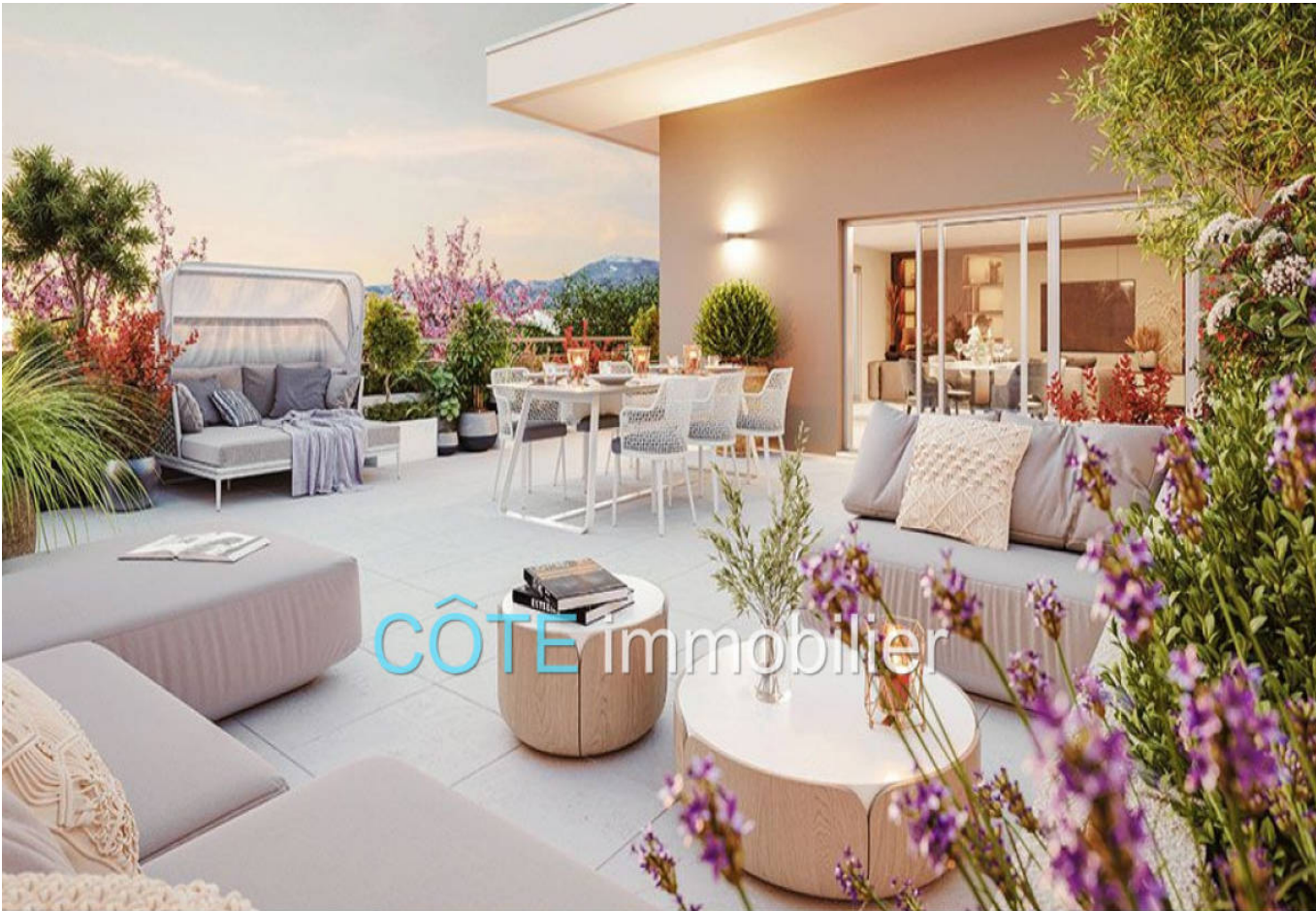
Programme neuf - Convention milancip - MLS Côte d'Azur