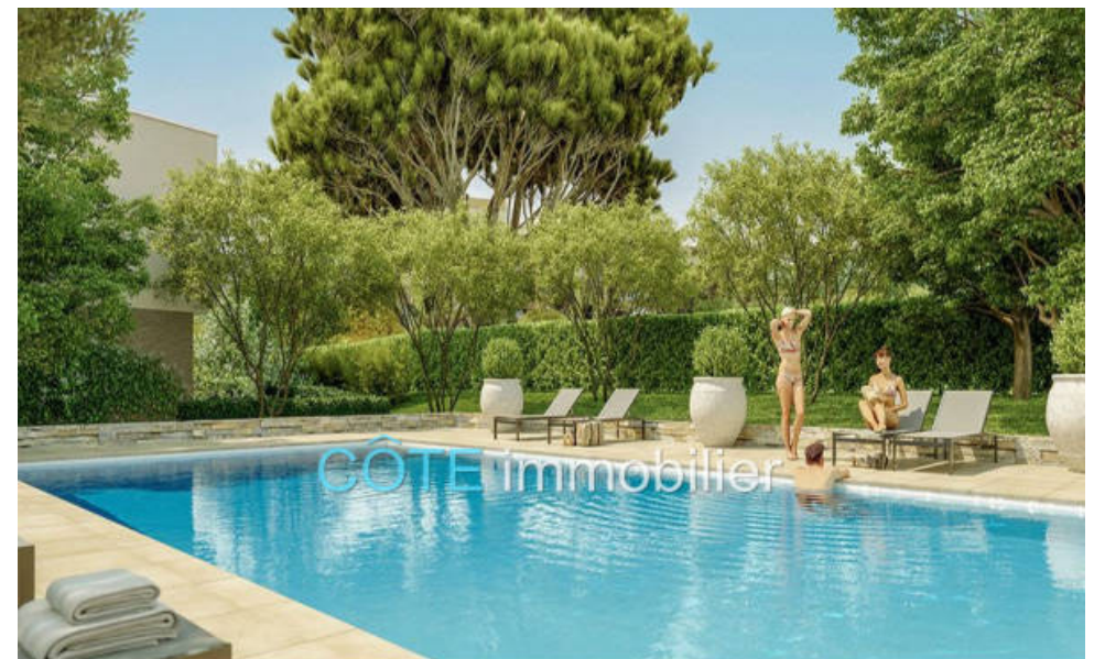
Programme neuf - Convention milancip - MLS Côte d'Azur