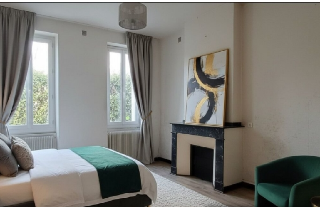
Projection d'aménagement réalisée par