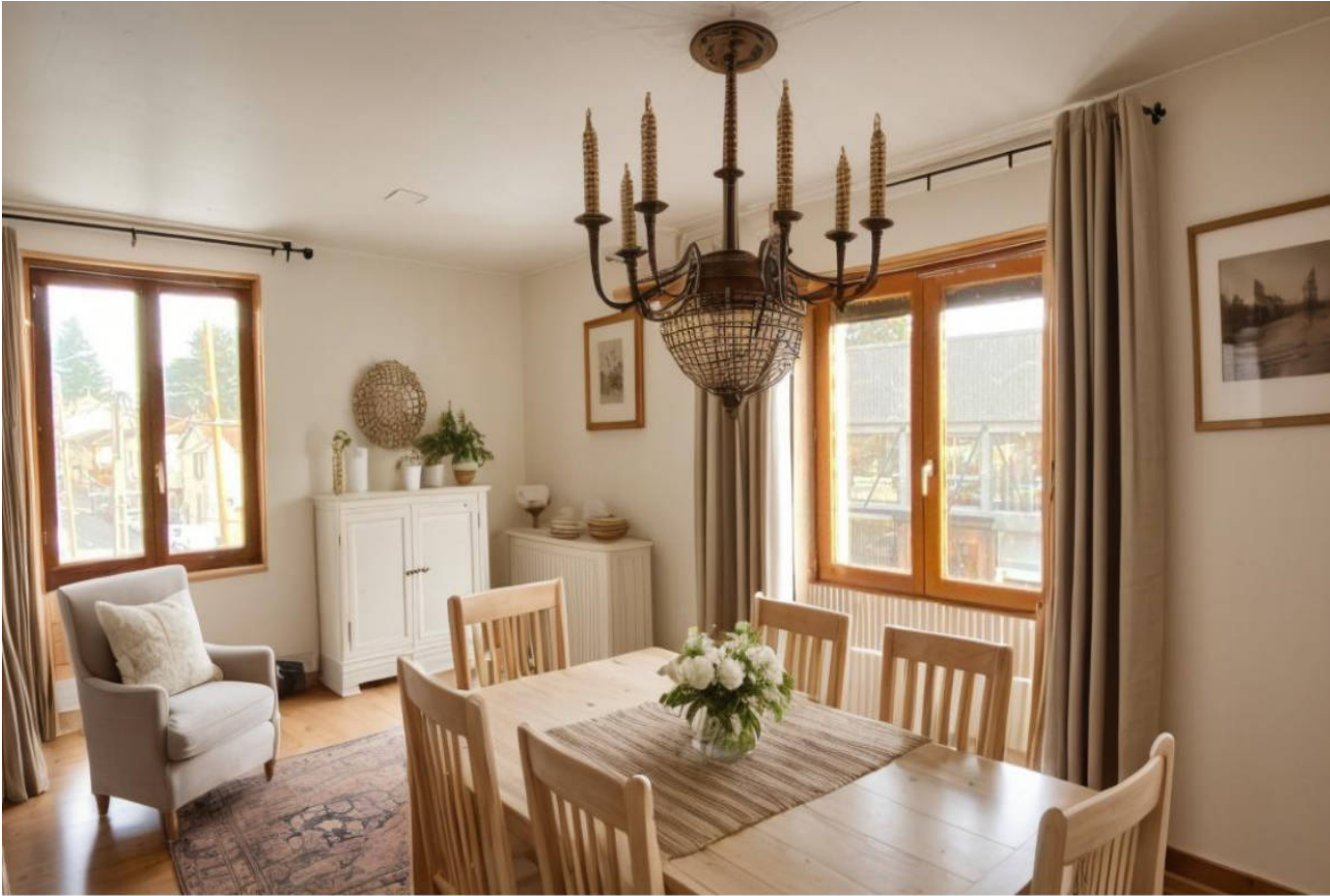
Proposition d'aménagement virtuel non contractuelle proposée par Flaash.ai