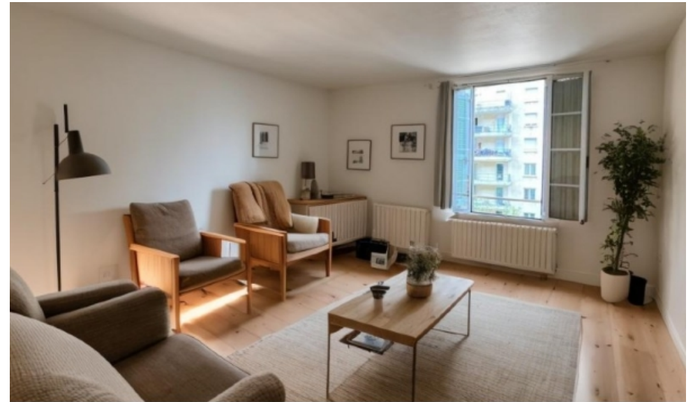
Proposition d'aménagement virtuel non contractuelle