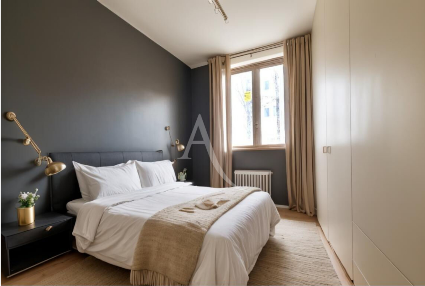
Proposition d'aménagement virtuel non contractuelle proposée par Flaash.ai