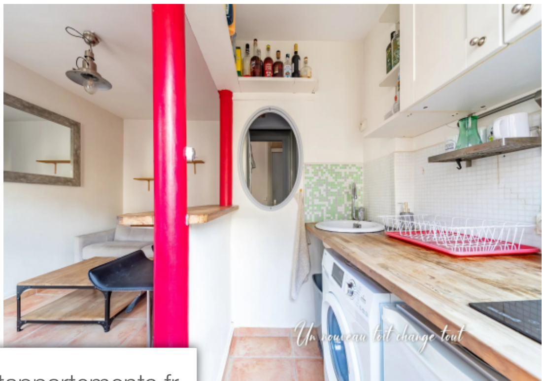
Un nouveau toit change tout