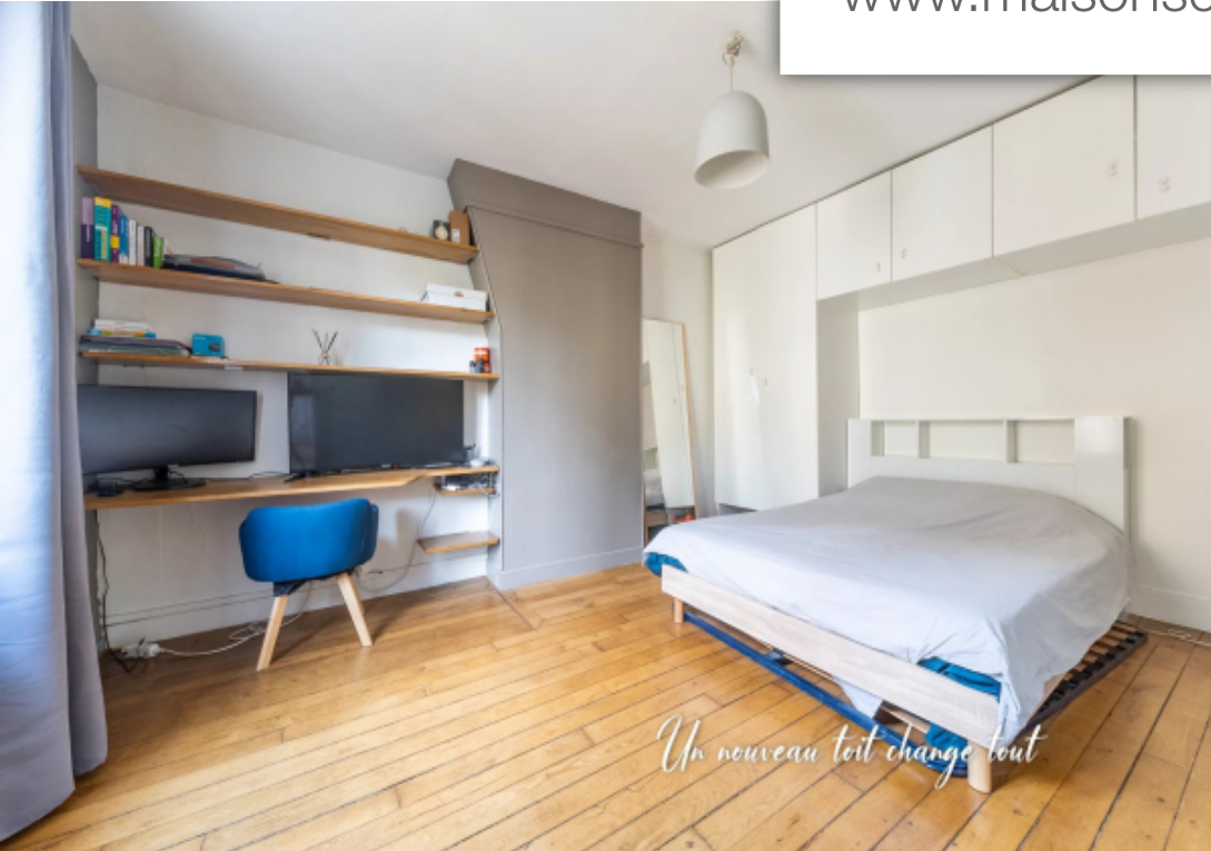
Un nouveau toit change tout