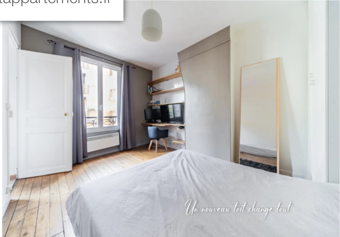
Un nouveau toit change tout