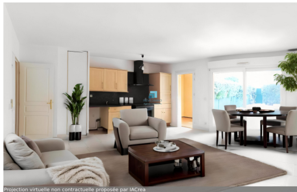
Projection virtuelle non contractuelle proposée par IACrea