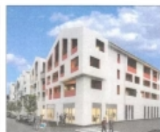
Bâtiment A - R+3