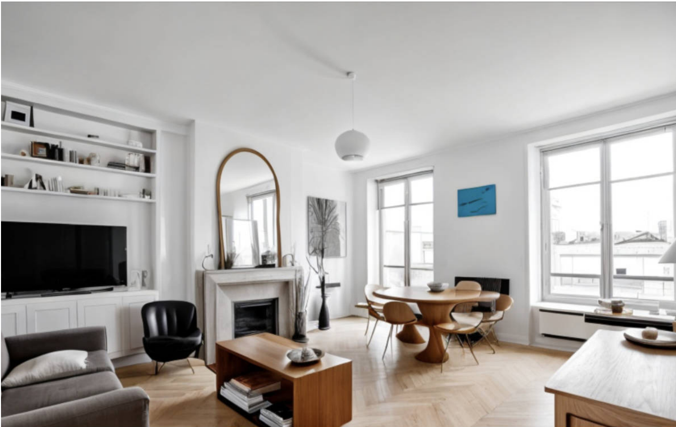
PROJECTION 3D - PROPOSITION D'AMÉNAGEMENT