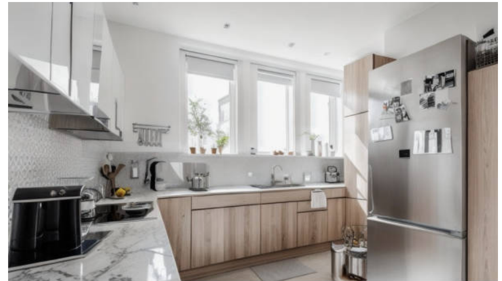
PROJECTION 3D - PROPOSITION D'AMÉNAGEMENT

Saint-Louis / Château - Au 3e et dernier étage d'un bel immeuble ancien en pierre de taille, Belmont Immobilier vous présente en avant-première un très bel appartement familial traversant, très lumineux et avec tout le charme de l'ancien - parquet en point de Hongrie, tommettes, cheminées en marbre. Cet appartement se compose comme suit : une agréable entrée qui dessert 3 grandes chambres, un séjour avec vue dégagée et verdoyante sans aucun vis-à-vis, une cuisine séparée (qu'il est possible d'ouvrir sur le séjour) un wc invité avec buanderie, une salle de bain avec baignoire et douche. Un grenier et une chambre de service complètent ce bien, qui nécessite quelques travaux pour révéler tout son potentiel et adapter son plan modulable en fonction des envies - une 4e chambre est possible. Photos et diagnostics en cours de réalisation (vidéo possible sur demande)