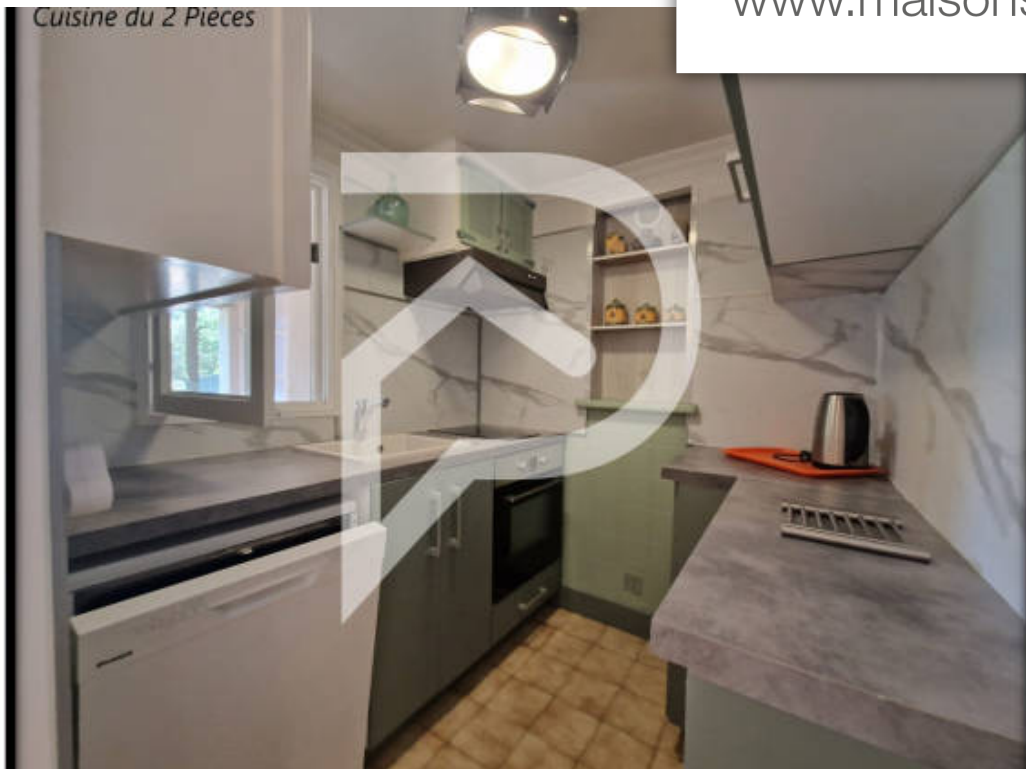
Cuisine du 2 Pièces