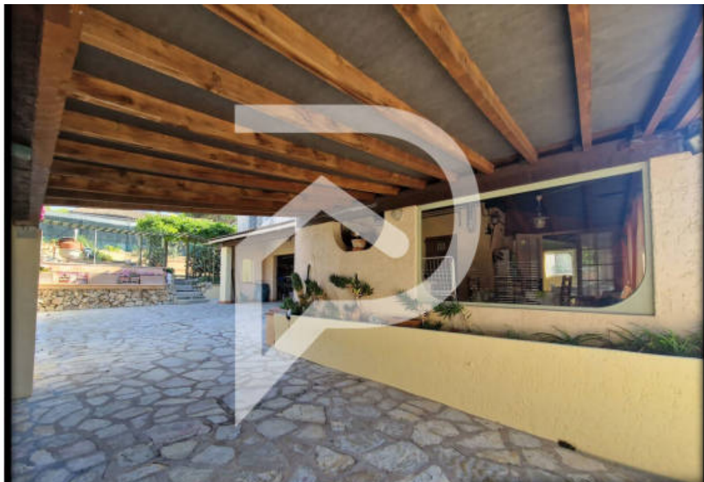
Carport Véhicules et accès au garage