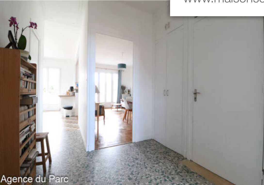
Agence du Parc