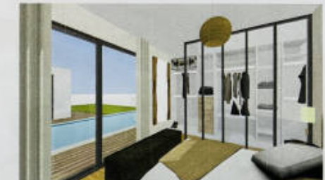
Une suite parentale de 18m 2 au RDC